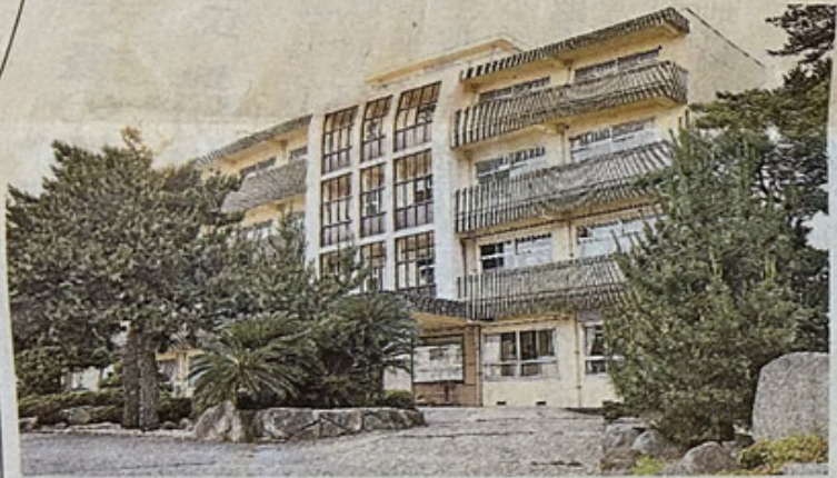
江津工業高校の校舎—江津市江津町