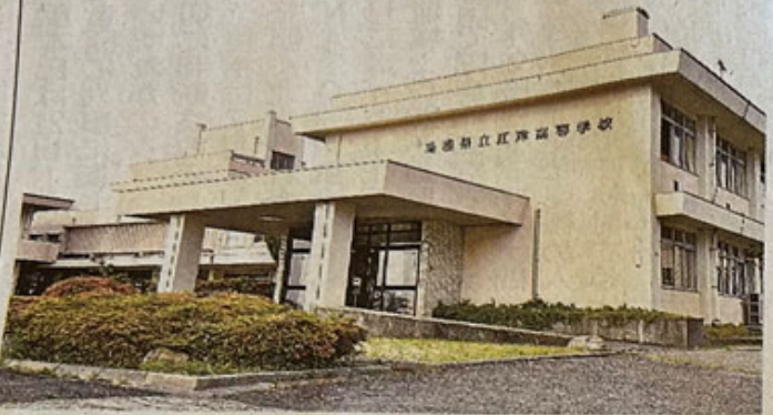
江津高校の校舎—江津市都野津町