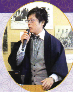
景山活弁士 ふるさとPR