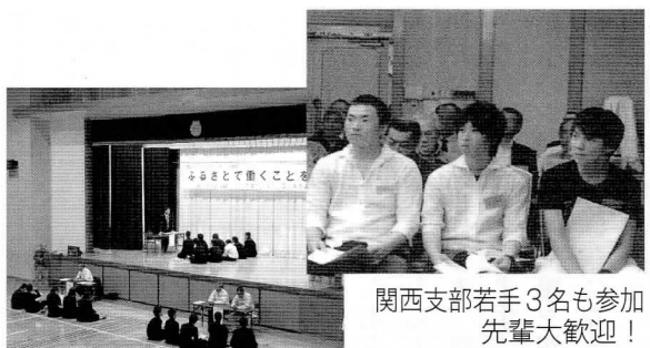
参加者も3名若手支部 先輩大歓迎!

④ 江津工業高校生とポリテク生の合同企業ガイダンス 十月二十六日(月) 於…江津工業体育館 地元企業十七社参加による石見地域産業を支える人材育成校として認識を新たにすると生徒の意識高揚を狙って開催した。(百七十三名参加)