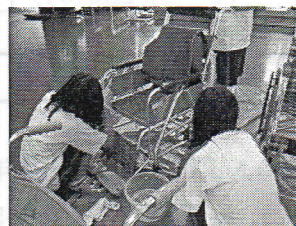
老人ホームボランティア